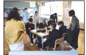
1年授業参観の様子

4月20日(土)に授業参観と学年懇談会、PTA総会を行いました。PTA総会では、全ての議案・予算案を承認していただき、今年度のPTA活動が始まります。よろしくお願いいたします。また、授業参観、学年懇談会もお世話になりました。ありがとうございました。