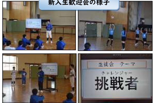
新入生歓迎会の様子

そして、最後に今年度の生徒会テーマを発表しました。今年度の生徒会テーマは「挑戦者（チャレンジャー）」です。このテーマのごとく、全校で様々なことに挑戦してほしいと思います。